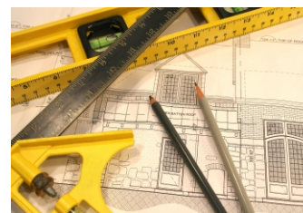
Visi šiltinimo darbai Renovacija